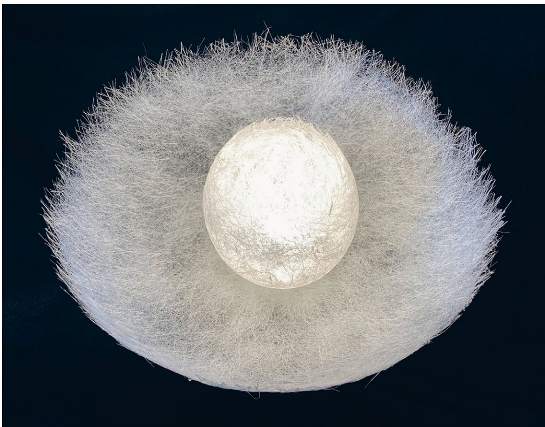
Leen Favre, luminaires