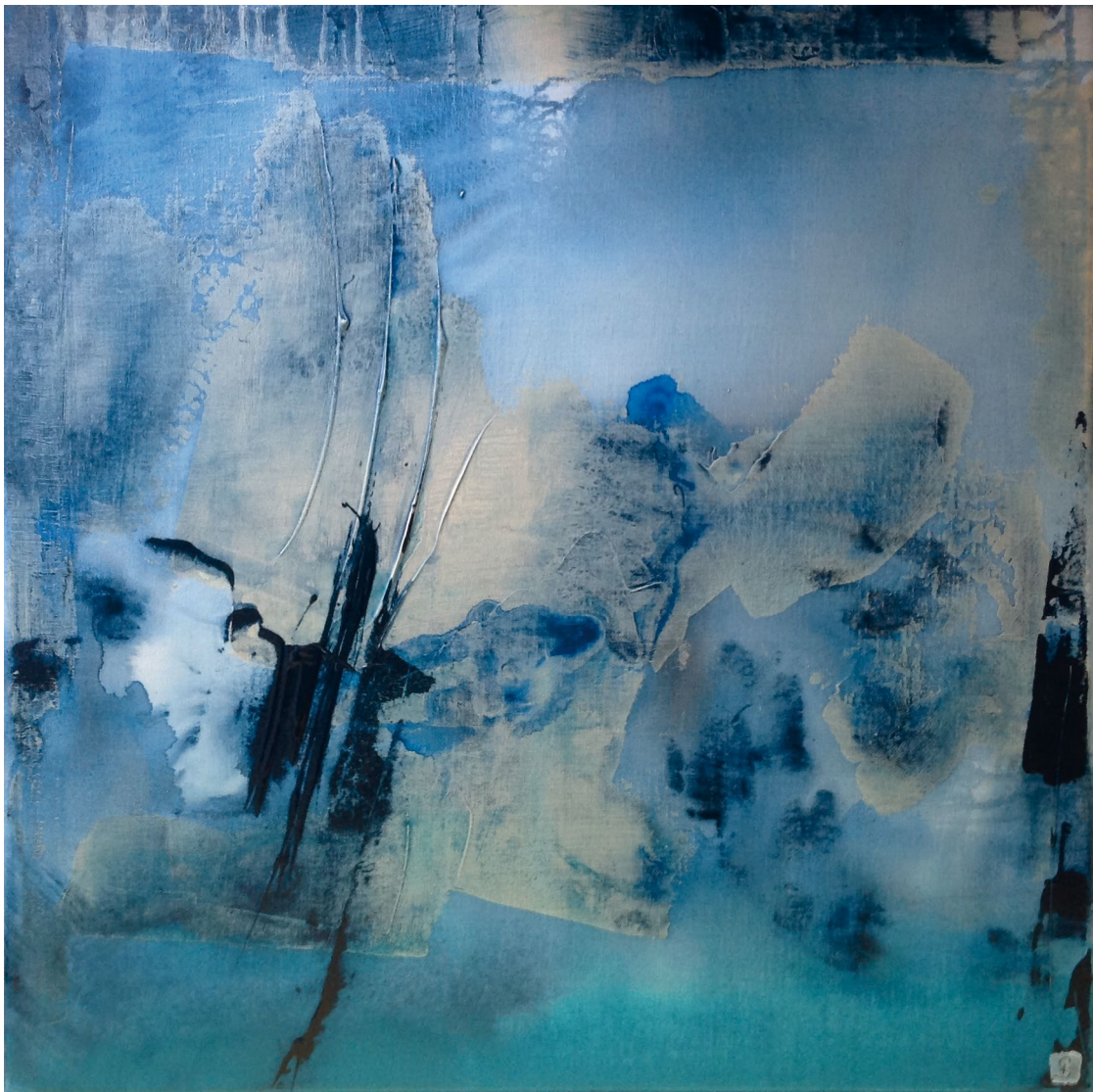
Chloé-D. Brocard, peintures